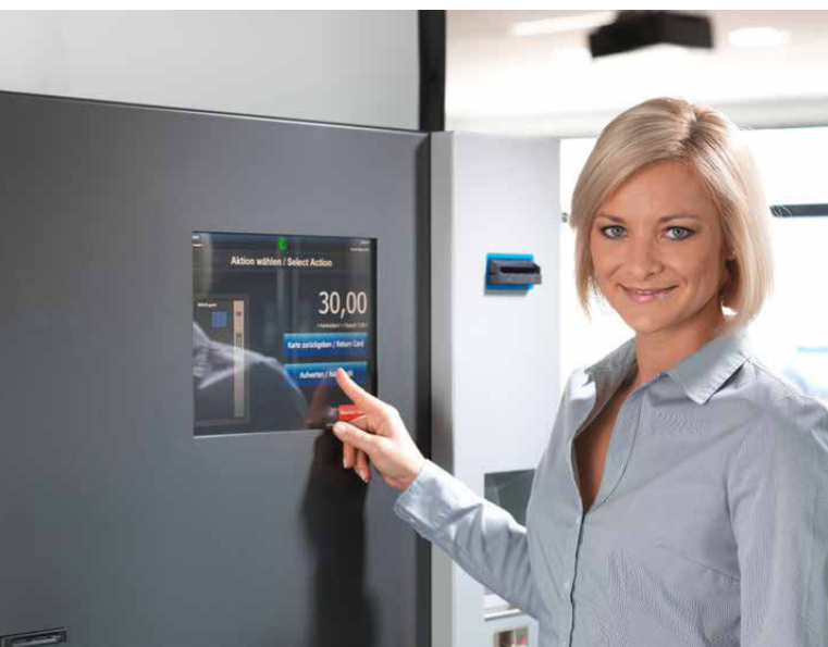
An den Automaten kann der Stadionbesucher Guthaben auf die Stadion-Bezahlkarte laden

An allen Kassen, mobilen Auflagern, sowie bei 9 Automaten kann Guthaben auf die Stadion-Bezahlkarte geladen werden. Bei der Bezahlung wird der Betrag mittels NFC-Technologie von der Karte abgebucht.