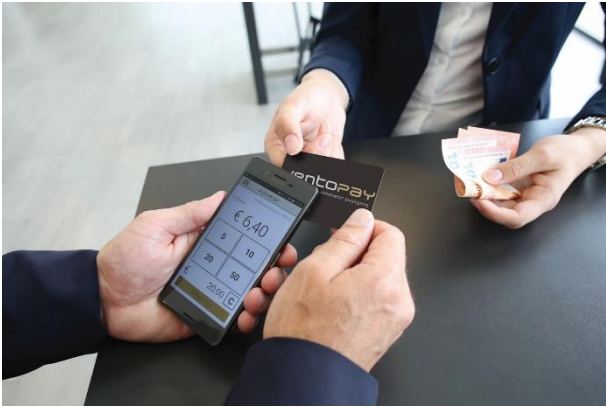
Mobile Kasse für Guthabenaufladung