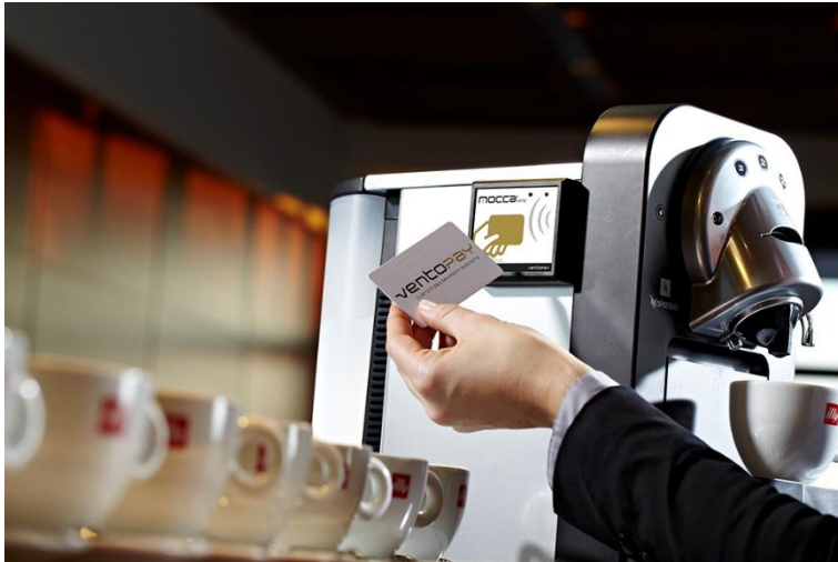
Abbildung 1: Das mocca.vend Automatenmodul