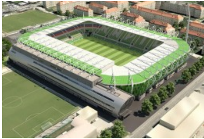
Allianz Stadion

Details Kategorie: Panorama Veröffentlicht am Freitag, 15. April 2016 12:12