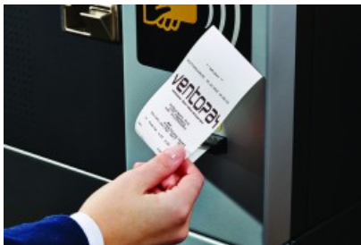
Druck des Kassenbons am mocca® Automaten

Details Kategorie: Panorama Veröffentlicht am Freitag, 28. Oktober 2016 13:25