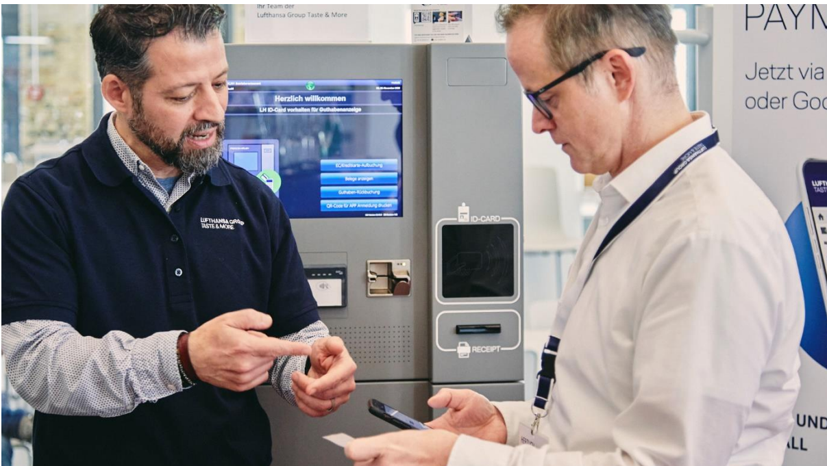
Digitalisierung, Prozessoptimierung und Nutzerfreundlichkeit stehen für ventopay im Vordergrund