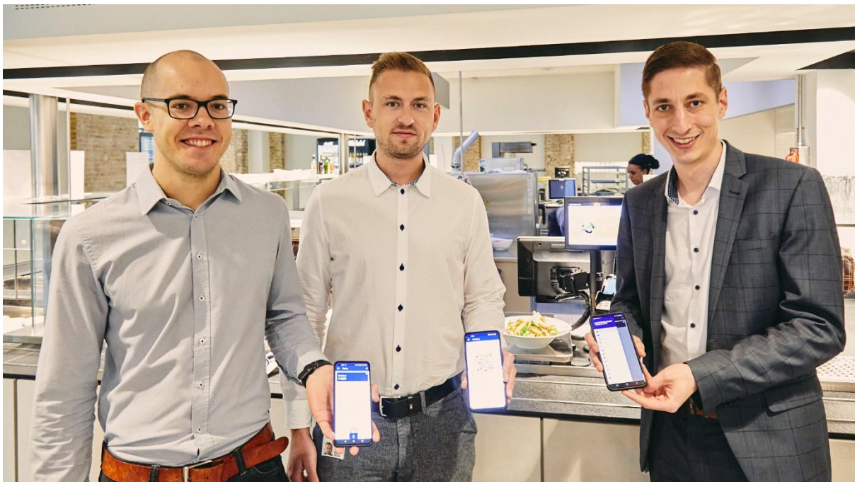
Das ventopay-Team präsentiert die neue Payment-App für die Lufthansa Group