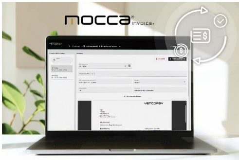
Abbildung 1: Automatische Rechnungslegung mit noCCA.invoice+