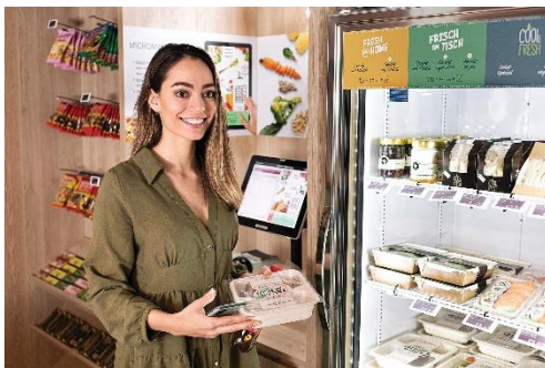
Abbildung 2: Rund um die Uhr Verpflegung mit Smart Fridges